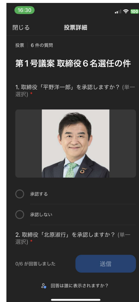
画像は投票時のイメージ